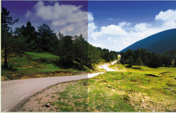
左面： 偏光鏡片效果