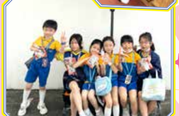
同學們在新佈置的休憩地方休息，與同學聊天和飲食，樂也融融！