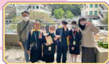
同學們學習環境的課題，如怎樣處理廚餘，更可以直接觸摸「黑水虻」。