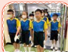
第二隊出場，心情難免緊張！

本校參加了由官立嘉道理爵士中學(西九龍)主辦的「心繫家國」聯校中式步操比賽，隊員接受四次工作坊的訓練後，需呈交升旗及步操的視頻，供大會甄選。結果本校升旗隊有幸進入決賽，並奪得銀獎。恭喜升旗隊！