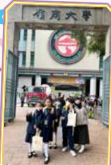
六年級同學到嶺南大學作一天的大學生體驗參觀。