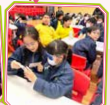
同學配戴道具，體驗長者不同方面的身體不便，理解他們日常生活的困難。