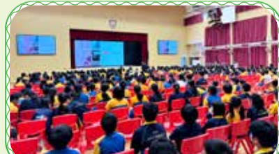
四至六年級「寵物」背後動物教育講座