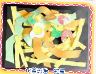
1C 黃筠貽 冠軍