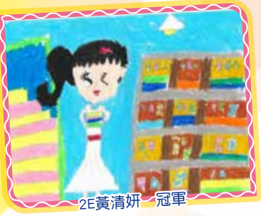
2E 黃清妍 冠軍