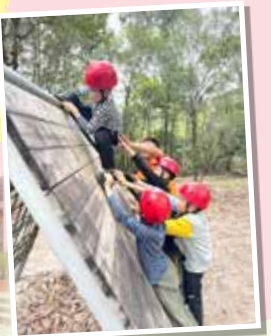
小四再戰營會——在營地參與不同的歷奇活動，體現團隊合作精神。