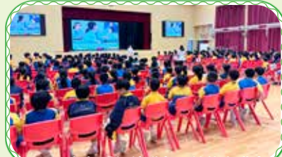
三、四年級「知情識友」性教育講座