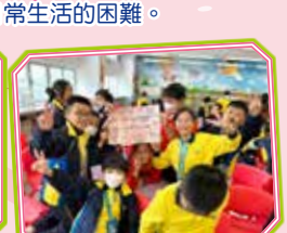
大家一起構思長者友善社區的建議，並拼貼在一起進行匯報。