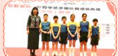
隊員奪得銀獎，恭喜升旗隊！