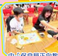
由「保良局正向教育團隊」專業講者帶領親子活動。