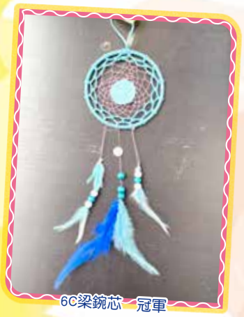
6C 梁婉芯 冠軍