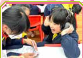
同學們的想法別出心裁，認真思考受助者的需要。