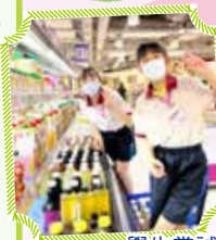
學生嘗試把貨品上架

為鼓勵學生探索未來職業取向，加強學生對生涯規劃的認識，本校12位小四及小五學生參加了永旺（香港）百貨有限公司舉辦之「AEON Dream」職業體驗活動，學生化身成AEON小職員，親身體驗在AEON店舖的各種工作，例如學習貨場整理、陳列及其他相關知識，了解百貨營運的基礎工作。