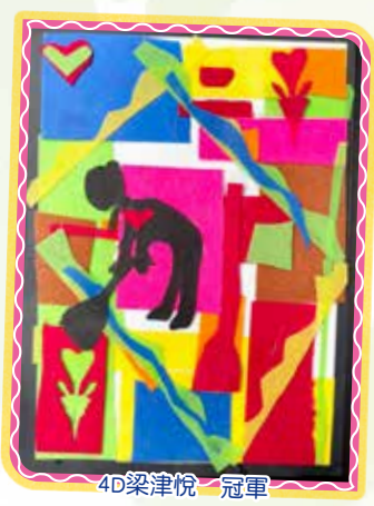
4D 梁津悅 冠軍