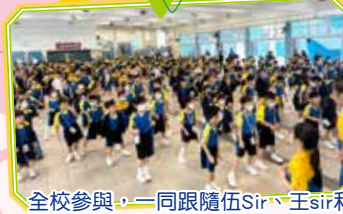
全校參與，一同跟隨伍Sir、王sir和早操大使進行早操。