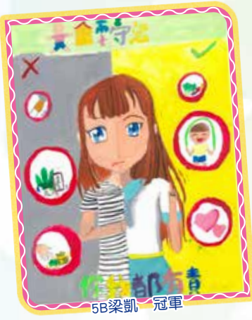
5B 梁凱嵐 冠軍