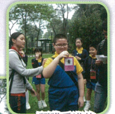
認識香港的野生動物