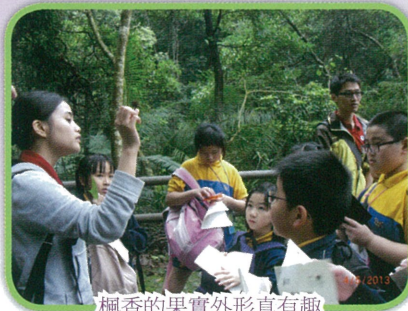
楓香的果實外形真有趣

香港的郊野公園不但景致迷人，更孕育着多采多姿、饒有趣味的野生生物，是最佳的自然教室。為推廣自然護理教育，漁農自然護理署推行「體驗自然」郊野公園教育活動計劃。本校同學在五月四日到大埔滘自然護理區進行戶外體驗活動，三位親切友善的導賞員透過集體遊戲、實地講解、工作紙等多元化活動，提高了同學對郊野公園、生物多樣性、植物護理、香港地質、遠足安全的認識及愛護自然環境的意識。