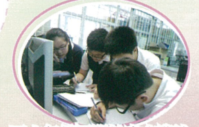
五六年級同學於中文啟迪班進行思維訓練，同學們正利用互聯網搜集資料。