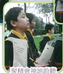
聚精會神地聆聽導賞員的講解