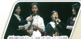
樂團兩位小號手作小司儀親自介紹我們的表演曲目。

本校銅管樂團有幸於「保良局屬下小學音樂匯演 2013」中演出，並可與其他屬校同學作音樂交流，實在獲益良多。