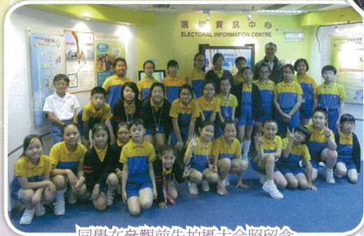
同學在參觀前先拍攝大合照留念