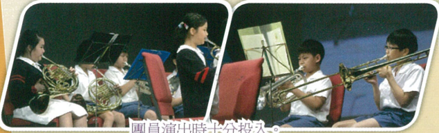
團員演出時十分投入。

本校銅管樂團有幸於「保良局屬下小學音樂匯演 2013」中演出，並可與其他屬校同學作音樂交流，實在獲益良多。