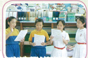
四年級同學在啟迪班以Readers Theatre的形式演示學習成果