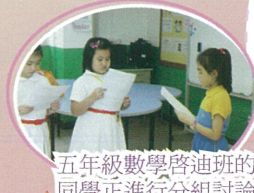
五年級數學啟迪班的同學正進行分組討論