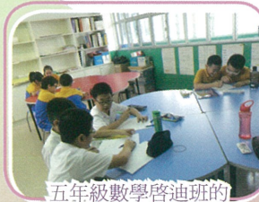
五年級數學啟迪班的同學正進行分組討論

我希望在六年級繼續有機會參加數學啟迪班，讓我可以和志同道合的同學一起研習，就更好了。