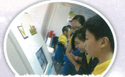
電腦虛擬活動幫助同學了解選舉的制度