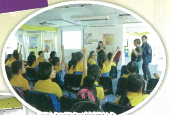
講座講解選舉法，同學上了寶貴的一課。

學校訓育組於本年的6月中舉辦了「參觀香港選舉辦事處」活動，同學除了認識香港的選舉制度外，也可藉此培養學生「公平」、「公開」和「誠實」等正確的選舉態度。