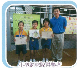
小型網球隊得獎者